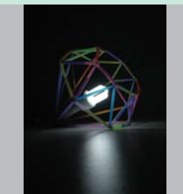
01. SANDRA BOŽIĆ Koautor DRAGAN STRUNJAŠ 1) LAMPA 1, 2 Veštačko krzno, kartonske tube od tepiha, staklena kugla, Otriaz-veštačka trava 2) UNIVERZALNI ENTERIJER PANO