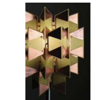
1. SVETLANA KOZHENOVA IZ KOLEKCIJE SVETLEČIH TELA „NEO CUBISTI“ Reciklabilni plastični materijali