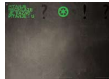
02. ZORAN BORENOVIĆ POSTER „RECIKLAŽA 2012“