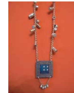
22. IVANA ČOTRIĆ 1) VARIJACIJE- OGRLICA 1, 2, 3, kombinovani delovi elektronskog i metalnog otpada 2) BROŠ, 3) MINĐUŠE