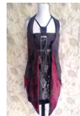
03. JELENA DANILOVIĆ PAVLICA ETNO VENCANICA 1, 2 Anterija, stari satovi, zavese