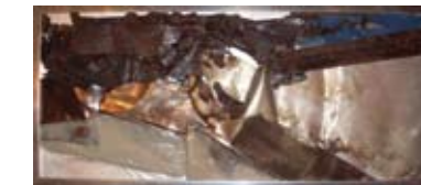
12. DRAGOSLAVA MILOSAVLJEVIĆ ASAMBLAŽ staklo, metalni otpad