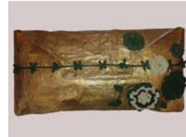
16. EMILIJKA PETROVIĆ TORBICA „PROLEĆE“ adaptirani plastični džak, aplikacija