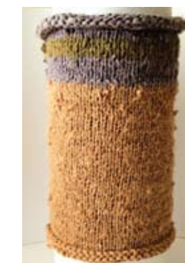
1. NATAŠA RADIN STUDIJE RECIKLAŽNOG METODA U DIZAJNU TEKSTILA Otpad svile ( tretiran mineralnim bojama), žice i drugih materijala