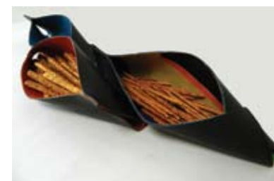
2. IRMA MIRVIĆ POSUDE „RUBBEINER“ Lepljenje i oblikovanje ostataka gume za obuću