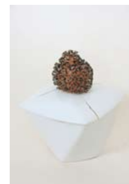
1. NADA KAŽIĆ PANDORINA POSUDA Lomljeni ready-made, metalni otpad