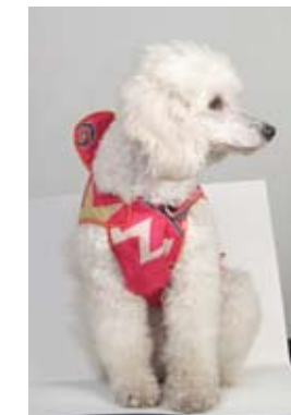
21. MARIJA TASOVAC 1) FIFI 2012 odelo za pudlu- reciklirani delovi slikane svile