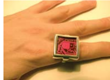
06. JELENA JAKŠIĆ 1) PETLJA, PRSTEN, MATIČNA PLOČA I SREBRO 2) ŠPIC, PRSTEN