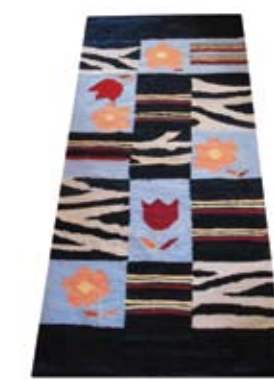
18. SONJA ROSIĆ PODNA PROSTIRKA ručno tkanje (klečana tehnika) pamučnog žerše otpada