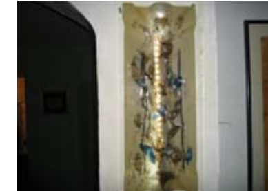
08. BOŠKO JOVANOVIĆ 1) LAMPA, FUZIJA STAKLA 2) ČAMAC