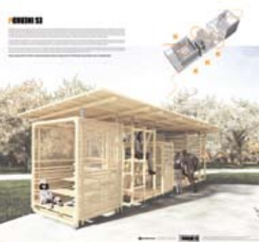
Projektant dia MILJANA NIKOLIĆ 1) STOLICA „PLAY ME“ Drvo iz industrijskog otpada 2) TIMSKI PROJEKAT/ RADIONICA pOKRENI SE, poster prezentacija