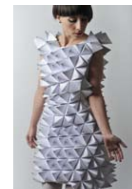
5. AMILA HRUSTIĆ IZ „PLATONOVE KOLEKCIJE“ Poster prezentacija, papir i tekstil