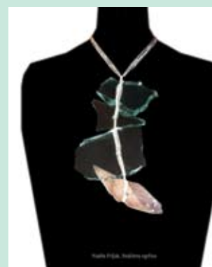
6. NADŽA FRLJAK OGRLICA 1, 2 Kombinovani stakleni otpad