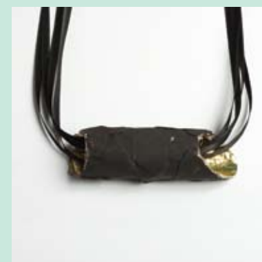
1. IVANA VUKOVIĆ KOLEKCIJA NAKITA „ROLI“ Lepljeni komadi šmirgi-papira