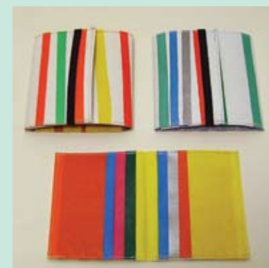
05. DEJAN DOŠLJAK NOVČANIK 1, 2 2) FUTROLA ZA BANKOVNE KARTICE