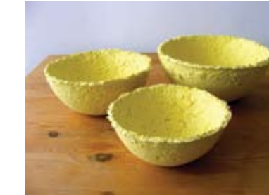
13. TAMARA NEDELJKOVIĆ VUKŠA GNEZDO 1, 2, 3, set posuda od recikliranih papirnih salveta