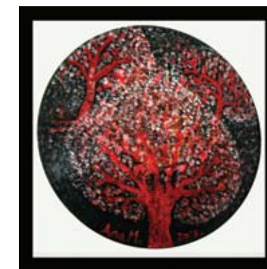
09. ANA MARINOVIĆ 1) OGRLICA, KOMBINOVANA TEHNIKA 2) SLIKA NA VINILNOJ GRAMOFONSKOJ PLOČI