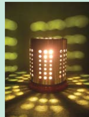
15. SLAĐANA NEŠKOVIĆ LAMPA „ILI „TAČKICA“ metal –roštraj