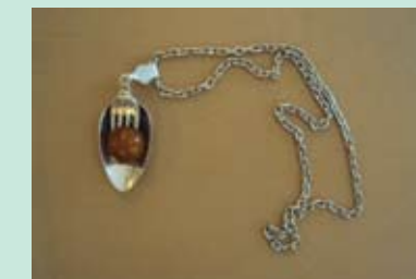
2. FRANJO POSAVEC OGRLICA delovi escajga, srebro, drvo