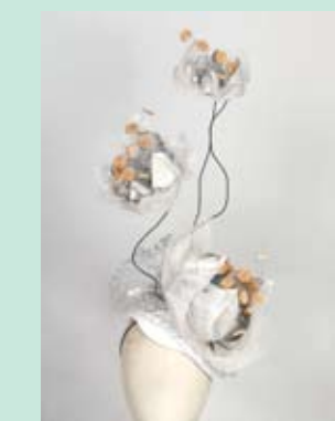
1. GENEVIEVE PAROIS LOTUS FLOWER Sešir, kombinovana tehnika-reciklaža (papir, žica, pluta)