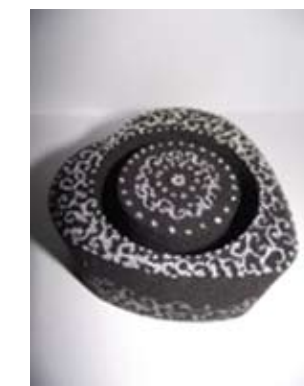
10. SLAĐANA MILOJEVIĆ POSTOLJE ZA NAKIT 1, 2 oslikana ambalaža SWACH